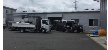
【新積み替え保管施設】

廃棄物の量や種類の増加に伴い、廃棄物積み替え保管施設移転により、容量が従来の約10倍になります。また、古い車両の入替や増車により、廃棄物受入体制を拡大し安全かつ適正な収集運搬が出来る体制を整えています。